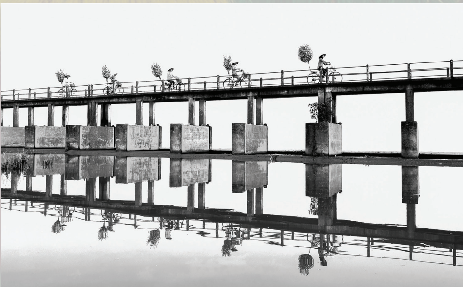
Những nốt nhạc xuân.