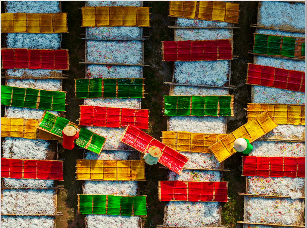
Trong nắng mai.