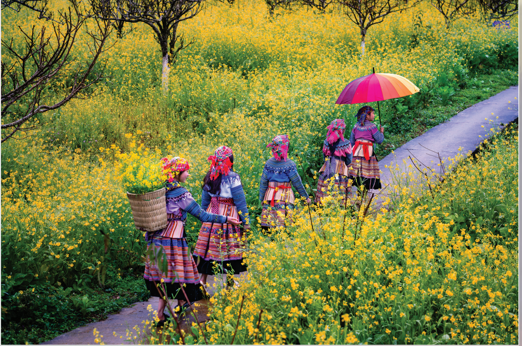
Đường về bản.