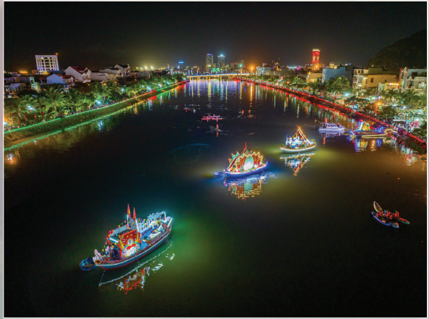
Đêm hội thuyền hoa.