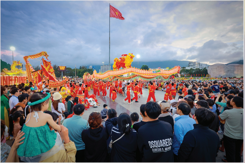
Rộn ràng xuân Quy Nhơn.