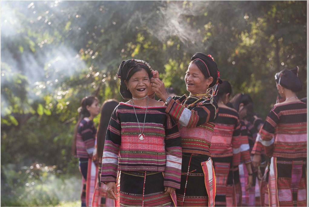
Vào hội.