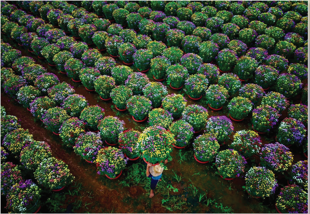
Vào vụ Tết. Ảnh: PHẠM HUY TRUNG