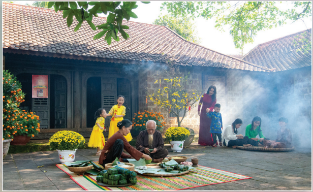
Tết đoàn viên.