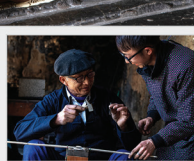
Nghề chạm bạc gia truyền ở Sùng Là.