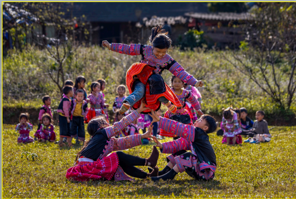
Xuân về trên bản H’mông. Ảnh: NGUYỄN XUÂN TUYẾN