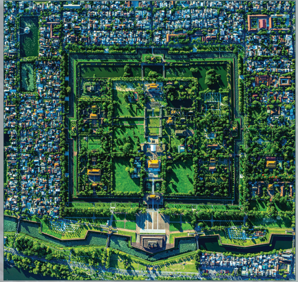
Đại nội kinh thành Huế.

Văn nghệ Bình Định trân trọng giới thiệu tác phẩm được chọn triển lãm của các tác giả Bình Định.