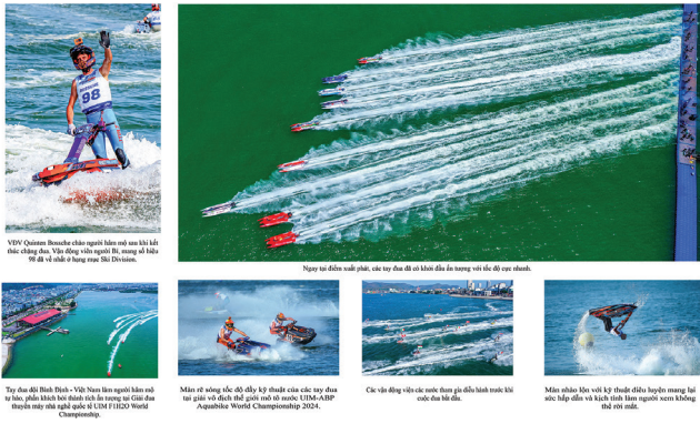
VTV Quoten Đua thuyền nhà nghề lần mở màn khi lễ cầu chung qua. Và đồng với người là, trong số hàng 100 chỉ số như ở hạng mục Ski Division. Ngày thi đấu nước phiêu, các tay đua đã nỗ lực đưa ra những cú rẽ đẹp mắt. Mọi nỗ lực đã đạt kỳ vọng của các tay đua tại giải vô địch thế giới mô tô nước UIM-ASP Aquatic World Championship 2024. Các vận động viên các nước tham gia đấu bình tranh khi nước đua lạt dần. Môn nhào lặn với kỹ thuật điêu luyện mang lại sức hấp dẫn và kích thích cảm giác thích thú không thể quên. Tay đua Bình Định - Việt Nam lên ngôi khi nỗ lực, phấn đấu đạt thành tích cao trong sự kiện đua thuyền máy nhà nghề quốc tế UIM F1H2O World Championship.

Từ ngày 22 - 31.3, tại TP Quy Nhon đã diễn ra Tuần lễ Amazing Bình Định Fest 2024. Đây là lần đầu tiên Bình Định tổ chức sự kiện thể thao quốc tế gắn với nhiều hoạt động thể thao, văn hóa và du lịch. Điểm nhấn tại Tuần lễ là Giải đua mô tô nước thế giới UIM-ASP Aquatic World Championship và Giải đua thuyền máy nhà nghề quốc tế UIM F1H2O World Championship - chặng Grand Prix of Bình Định 2024. Đây là sự kiện thể thao đặc biệt, lần đầu tiên được tổ chức tại Việt Nam và Bình Định là địa phương vinh dự đăng cai tổ chức đã thu hút đông đảo người dân, du khách trong và ngoài nước đến theo dõi, cũng là lần đầu tiên có đội đua thuyền máy F1H2O mang tên Bình Định - Việt Nam tham dự giải đấu.