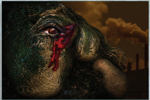
Nước mắt (Thể loại ảnh ý tưởng).