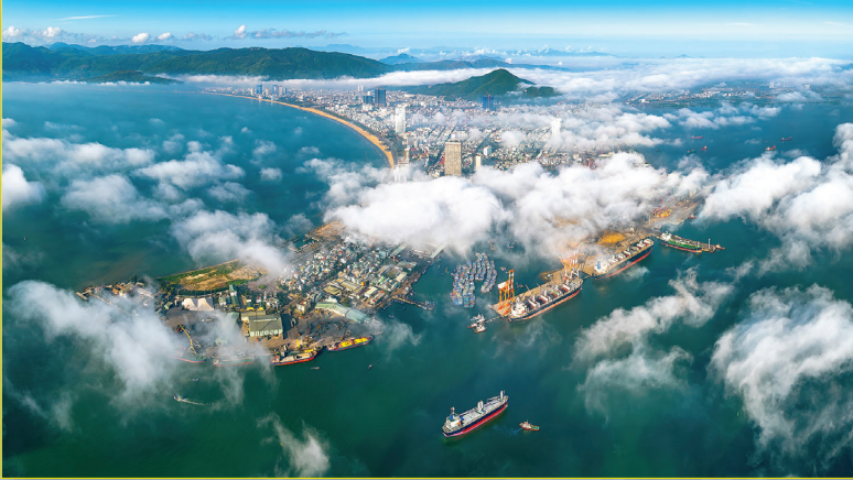
Quy Nhon - Thành phố ba bờ sóng vỗ. Ảnh: NGUYỄN MINH QUANG