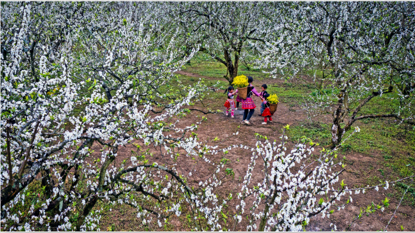
Mộc Châu mùa hoa mận.