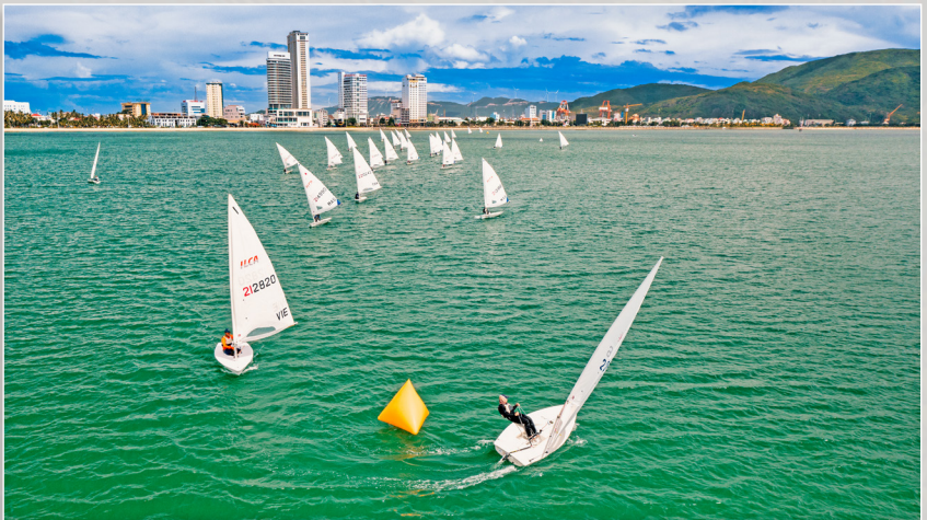
Đua thuyền buồm quốc tế trên biển Quy Nhơn.