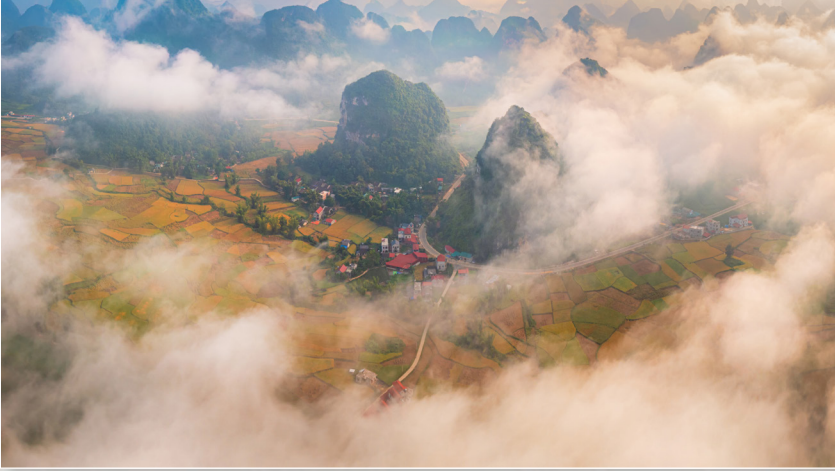
Cao Bằng mùa lúa chín.