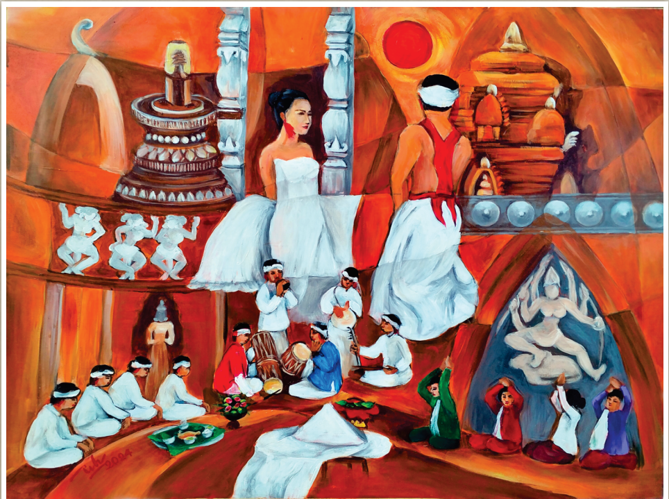
Tác phẩm: ƯỚC VỌNG NGÀN ĐỜI Chất liệu: Acrylic - tổng hợp * KT: 60cm x 80cm Tác giả: Bùi Thị Tịnh