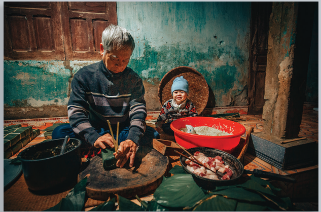
Phong vị Tết.