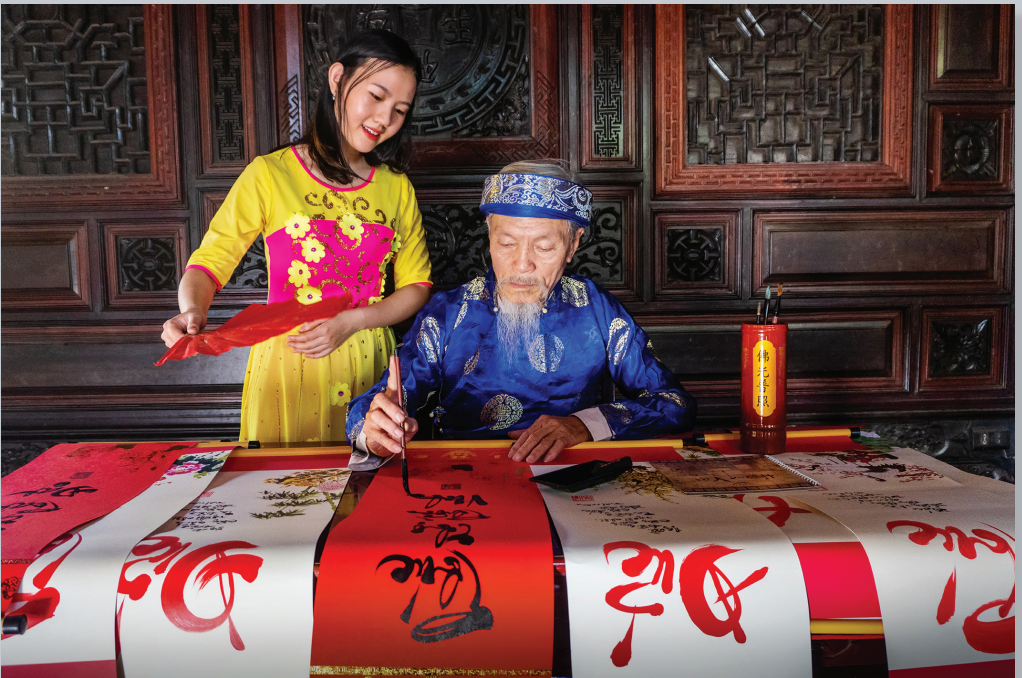
Viết thư pháp ngày xuân.