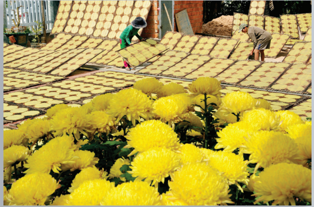
Nắng xuân.

Văn nghệ Bình Định trân trọng giới thiệu những khoảnh khắc xuân do các nghệ sĩ nhiếp ảnh Bình Định ghi lại.