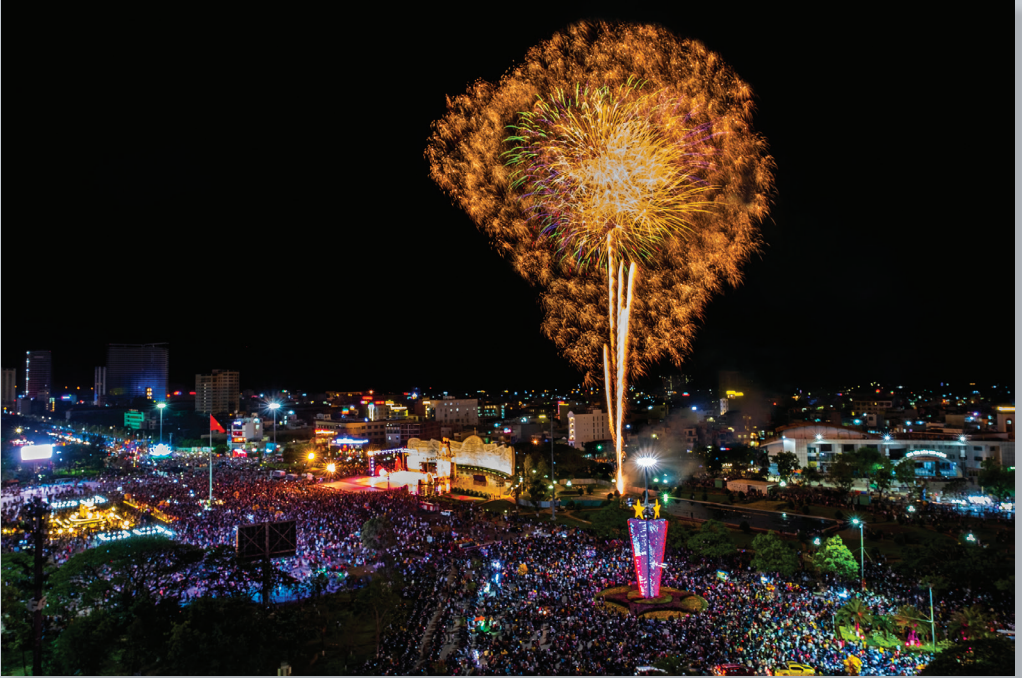
Đón chào năm mới.