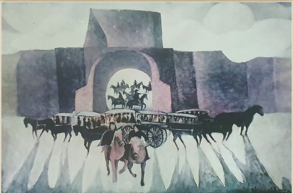
"Cửa Tây thành Bình Định" - Họa sĩ Quốc Hùng