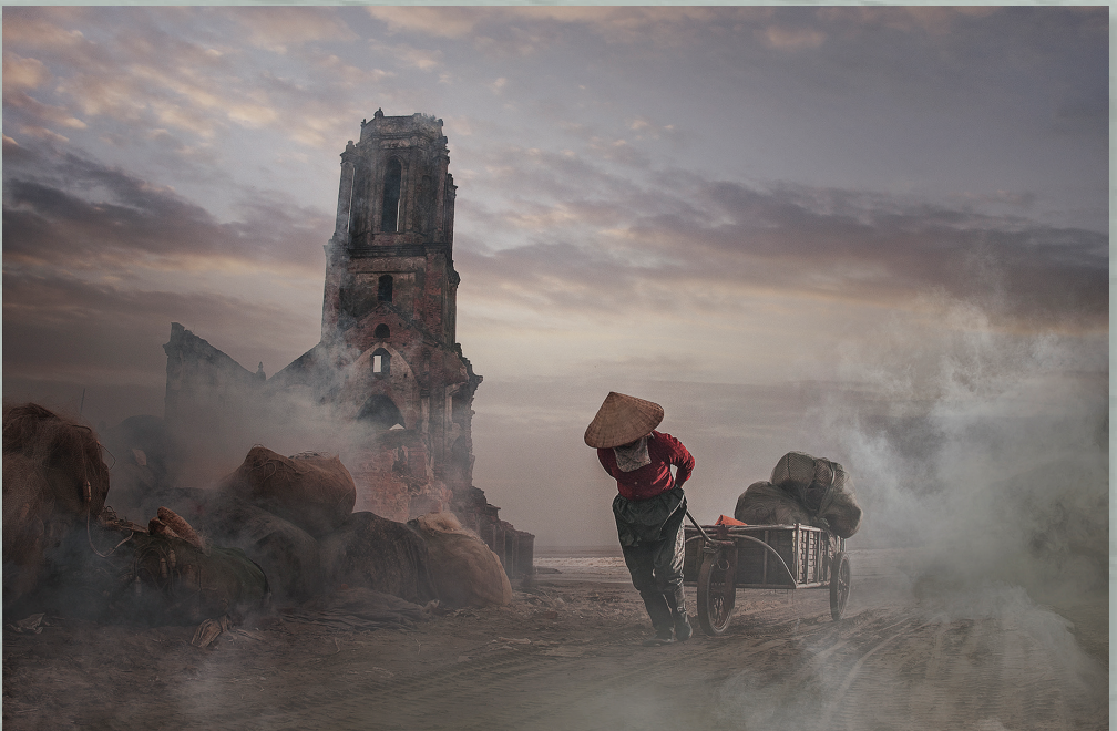
Về nhà (Tác phẩm triển lãm) - VÕ HOÀI HUY