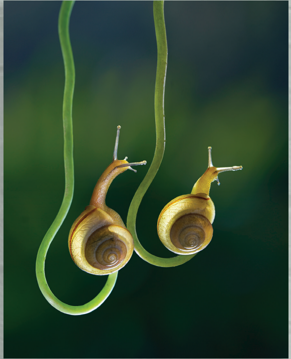
Nốt nhạc chung đôi (Tác phẩm triển lãm) - VÕ HOÀI HUY

Văn nghệ Bình Định trân trọng giới thiệu đến bạn đọc.