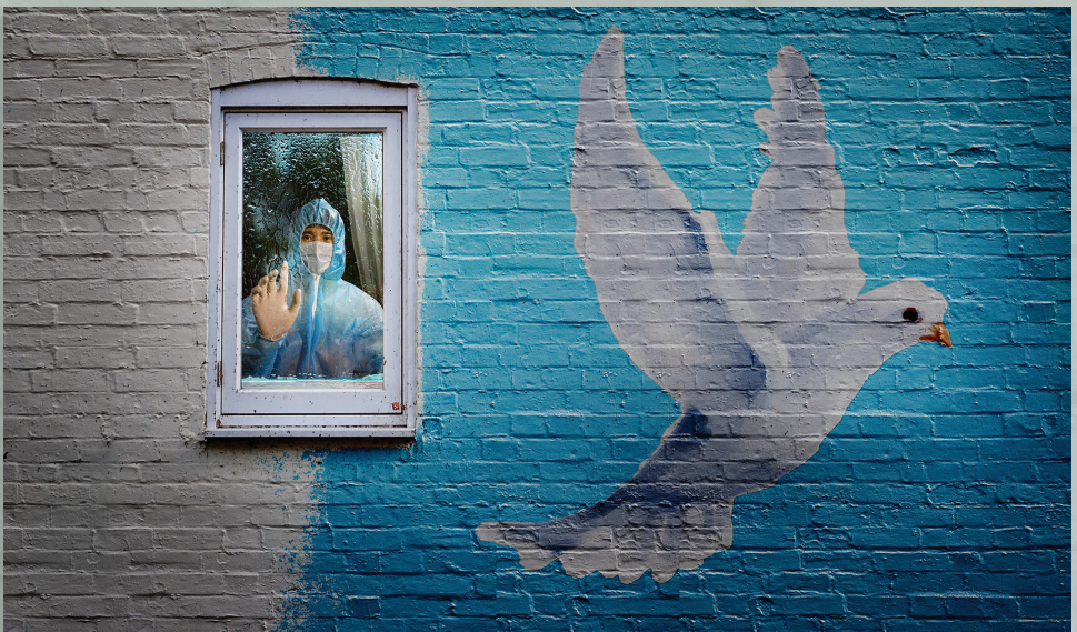
Hy vọng (Tác phẩm đoạt giải Ảnh ý tưởng) - VÕ HOÀI HUY