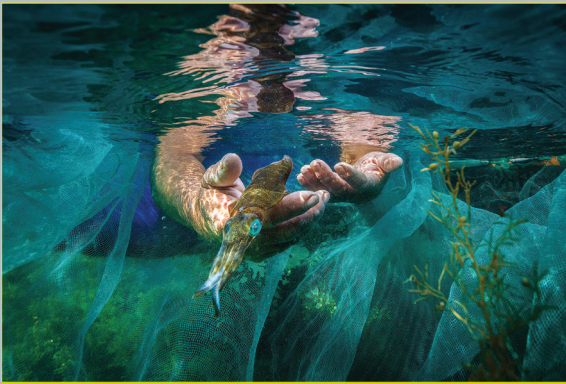
Mực giống tự nhiên được lấy lên hết sức cẩn thận