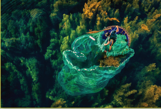
Quá trình kéo lưới cẩn thận đảm bảo không ảnh hưởng hệ sinh thái rong