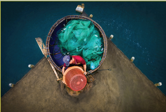
Thả thức ăn vào cửa lồng mực