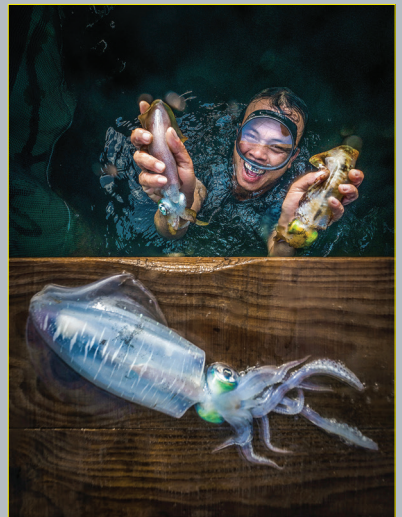
Niềm vui với thành quả