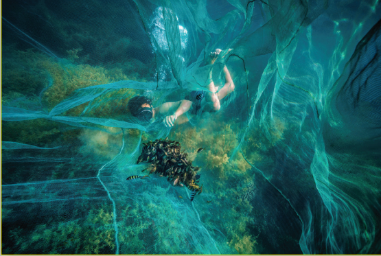
Lặn sâu dưới đáy biển để gỡ lưới không làm hư hại tới rong