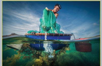
Cá kình, cá giò... là nguồn thức ăn chính của mực