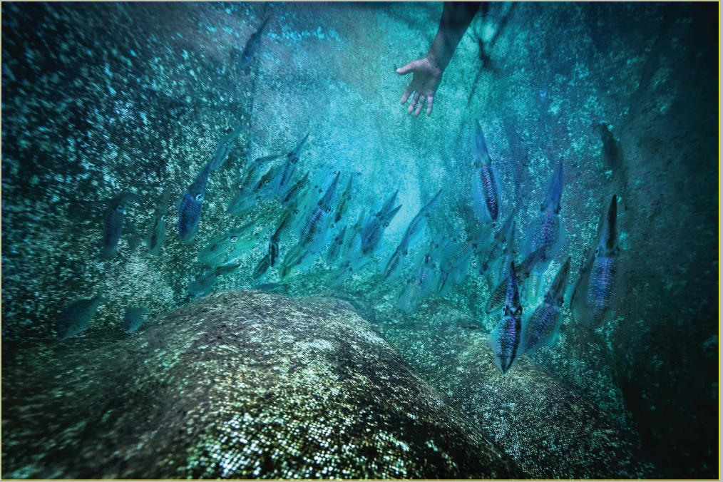
Mực được nuôi trong lồng với số lượng từ 40-80 con